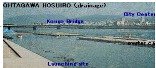
カキ筏と杭: 庚午橋から下流の右岸側はカキ筏の繋留地となっている。左岸はカキヒビの杭が多く、要注意。