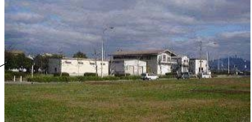
広大, 工大 & 工大高, 皆実高, 修道大の艇庫が集まる。