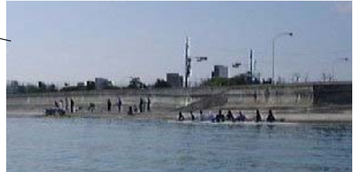
発艇場: コンクリート護岸に階段。広島西飛行場: 地方の空港を結ぶ小さなコミューター便のみとなった。