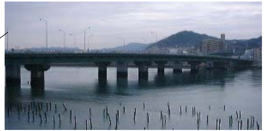
庚午橋 [水門+6420m/800m+艇庫]: これを境に上・下流で波況が異なることが多い。橋上からの釣りに注意