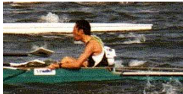
前腕をガンネルに当てて上体を安定させる。

ラダー・ロープは、一般に体の前に回して(1)、左右同じ位置にある取っ手を持ち、前腕をガンネルに添え、ガンネルといっしょに持って安定させます。ロープを緩めて水面に当てたり、特に(逆流の時に)ラダーの逆転や過負荷になったりしないよう張っておくことが大切です。