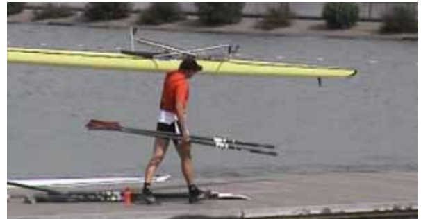
裏返して運ぶのが基本。ハルを下にして運ぶ時は極力慎重に！ また基本的には、(上のようにでなく)艇とオールは別に運ぼう。