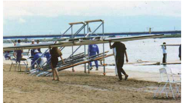
シングルスカルを二人で運ぶ場合。(ハードデッキの場合は裏返して)

シングルスカルの場合は、基本は一人で、デッキを下にシートを頭に載せるか、横にしてガンを肩に載せ運びます。ハルを下にする場合、細心の注意が必要で、注意しないとすぐにハルを傷めます。慣れないうちは、2人で両端から1m～2m内側を持つか、補助をつけて運びましょう。