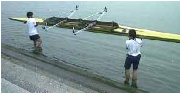
ダブルスカルは、前後デッキの中央～中寄りで持ちましょう

ダブルスカルは、艇端から約2mのあたりを持ちます。端で持ったまま長く運んではいけません。