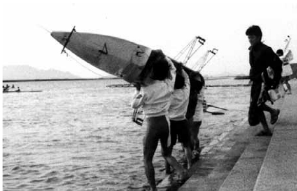
肩に担いだ艇を差し上げ、回転しながら水面に降ろす

艇を回転させるときは、タイミングを合わせ、艇軸を常に地面に平行に。合わせないと、艇が傾き地面に接触します。