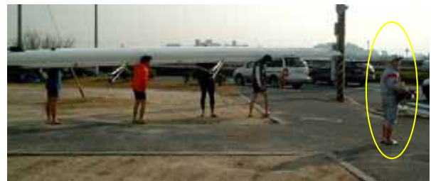
このように舵手は少し離れて全体が見渡せる位置をとる。

舵手は艇から少し離れ、常に艇全体を見ることのできる位置に立ちます。舵手や補助者がバウポールまたは艇尾を持って移動するのは、一見安全そうですが、艇の另一端のリスクが高まり、また舵手のレベルアップの障害にもなります。舵手は、手を触れることなく、声だけで漕手を介して艇を制御します。もちろん、初心者のクルーでは、また大会会場などの混雑した状況では、サポートがあっても良いでしょう。しかし舵手自身は、最終的に、艇から離れた位置で全体を見渡しながら、クルーをしっかりとコントロールできるようにするのが、とても重要です。