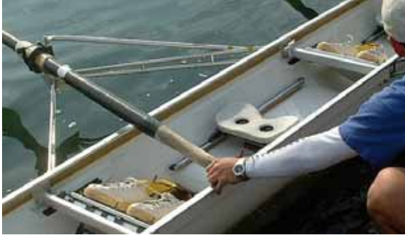
オールの支点(ピボット)を支えるアウトリガー

オールの支点となるオールロックを支えるために、ガンネル(舷側)から外に突き出したフレームを、リガー(アウトリガー)といいます。金属製のパイプや新素材を用いたウイング・リガーなど、さまざまなタイプがあります。