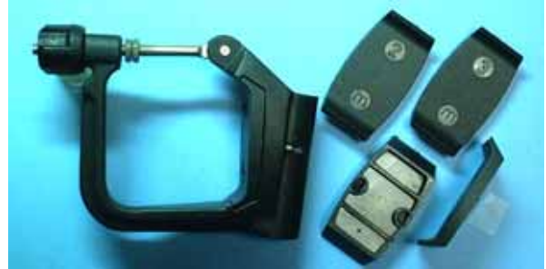
フェイスを交換するタイプのオールロック(マルチナリ製)

には、その固有カバー角を調整するため、偏芯プッシュを交換するタイプやフェイスを交換するタイプがあります。