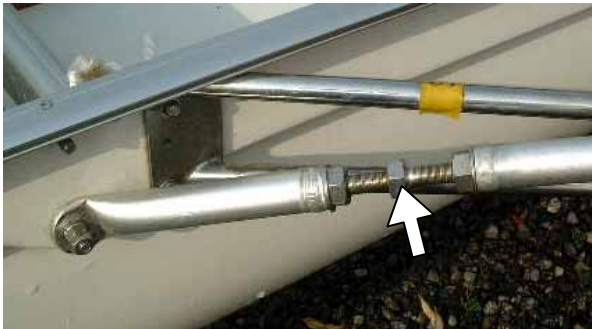
トップステイのターンバックル。左ネジに注意。

バックステイは、オールロックの角度を調整する部品ではないので、先にオールロック部分を正確に組みつけ固定し、その後でそれに合わせてバックステイの長さを調整します。