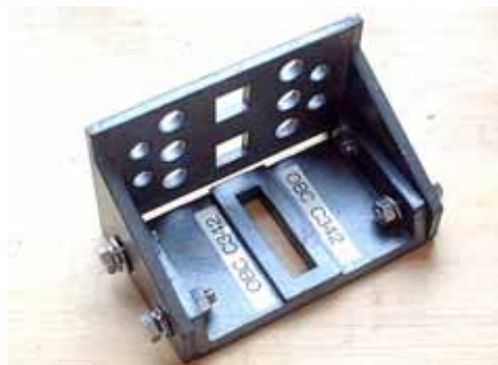
L板(左)や、ウイング・リガーのブロック