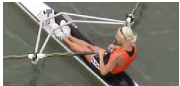
左手側が右舷で、右手側が左舷。

なお、「左」とか「右」だけでは、手のサイドか、舷側を言っているのか混乱することがあるので、「右手、左手」などと、はっきりいうことが大切です。