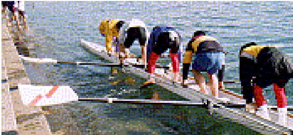
出艇・離岸(けりだし)

オールロックのゲートを確認にロックし、ソックスを履き、ストレッチャーに足を固定、スライドや各部の固定を確認する。