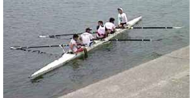
適切な進入角度と艇速の制御が大切。脚はガンネルにかけないで。