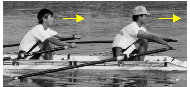
水平に前を見ることがバランスその他にとっても重要