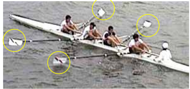
スクウェアのタイミングの違いはバランスに強く影響する。

下の写真の場合は、フェザーからスクウェアのタイミングがずれている(整調のスクウェアが最も早く、写真の撮影時点でパウペアがスクウェアをしているところです。3番はさらに後でスクウェアに戻すことになります)。そのため、フォワード中に艇が不安定にロールします。