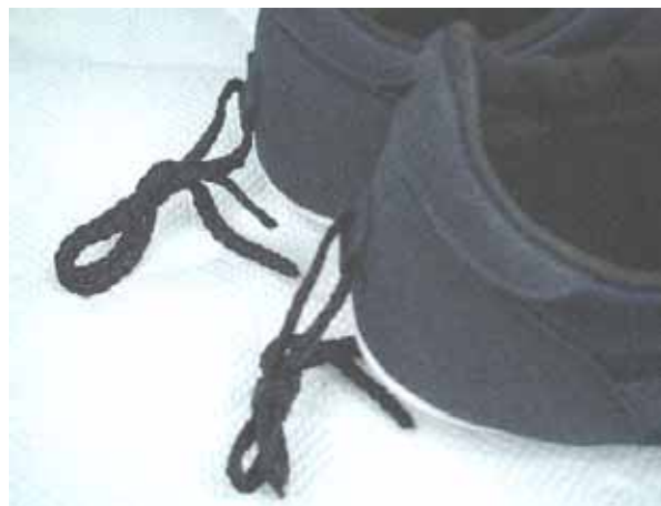
かかどについている紐をストレッチャーに結びます。

ローイング・シューズには、沈のとき容易にシューズが脱げるように、ヒールの上がり過ぎを防ぐヒモがついています(ヒール・コード)。安全のため、この紐は決して外してはいけません。長さを正しく調整しておきましょう(4cm以下)。