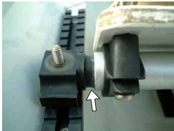
バーが抜け出ると、正しい位置に固定できず、艇にも無理がかかる

ストレッチャーボード、シューズの左と右で、前後位置がずれていたり、左か右にずれていないか、よく点検しましょう。