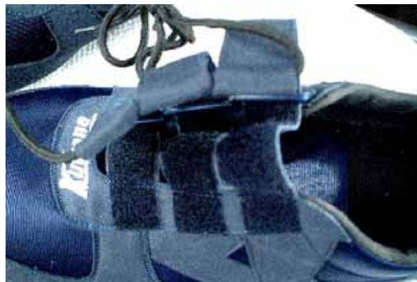
紐を引けば簡単に脱げるローイング・シューズ。

シューズは、一般的なジョギングシューズやローイング専用のシューズが取り付けられています。ローイング専用のシューズは、甲の部分がベルクロ(マジックテープ)式になっていて、沈しても簡単に靴が脱げるように工夫されています。また、サイズはあなたに合っていますか？