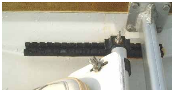
ストレッチャーボードは適切に締めること。締めすぎないこと

ストレッチャーは前後、高さ、傾斜などを自分に合わせて調整し、また緩まないように固定します。しかし、ネジを締めすぎているケースもあります。締めつけすぎると、固定金具が変形します。特に、プライヤーをねかせて蝶ネジをはさみ、ぎゅうぎゅう締めつけるのは厳禁です。